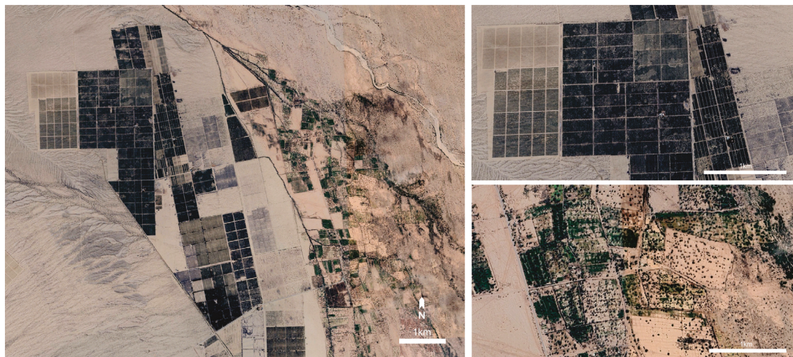
Figura IV. Izquierda: imagen satelital donde se aprecia las parcelas productivas (diferimientos impositivos) de jojoba y olivo alrededor del pueblo de Bañado de Los Pantanos. Derecha: detalle de las parcelas (arriba) y los rastrojos (abajo).

gasta por Palmisano y Miguel (2025)-. Nos cabe la pregunta, entonces: ¿qué relación hay entre la escasez de agua -vívica y experimentada por los puesteros- con la instalación y expansión de los diferimientos impositivos de monocultivo en Bañado de Los Pantanos? ¿cuántas perforaciones existen? ¿cuántos litros de agua consumen? ¿hay control estatal?