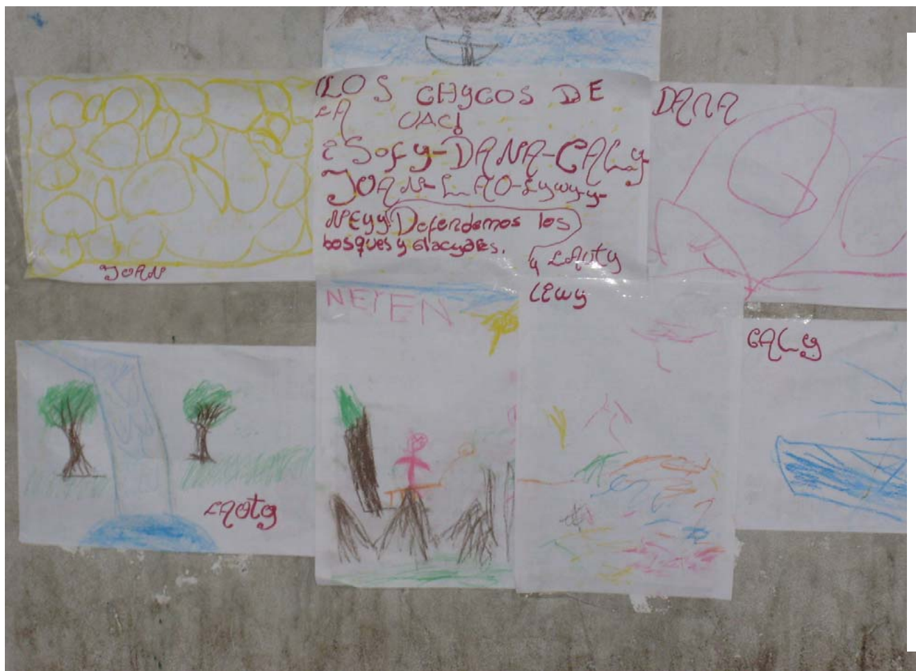
IMAGEN 6: Con lápices y crayones “los chicos de la UAC” dejaron sus pintadas en una de las paredes del Pucará.