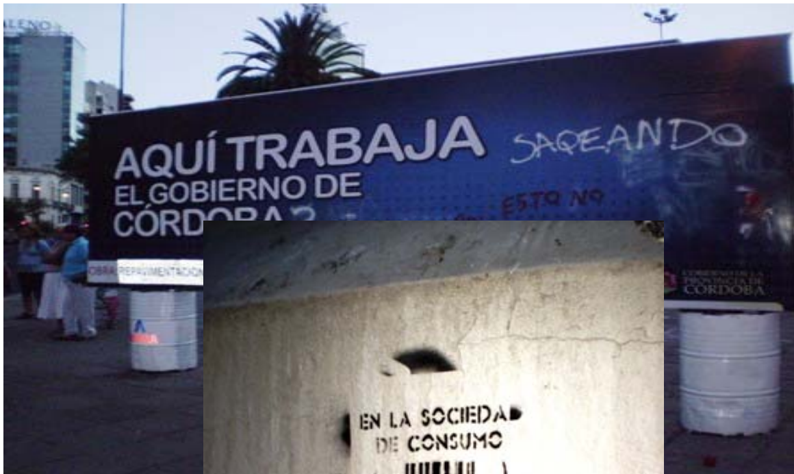
IMAGENES 7, 8 y 9: Los grafities de la marcha expresaron el problema de los bienes comunes, considerados como recursos naturales y su destrucción acelerada de la mano del crecimiento compulsivo de la sociedad capitalista de consumo y la complicidad del saqueo con los gobiernos provinciales.