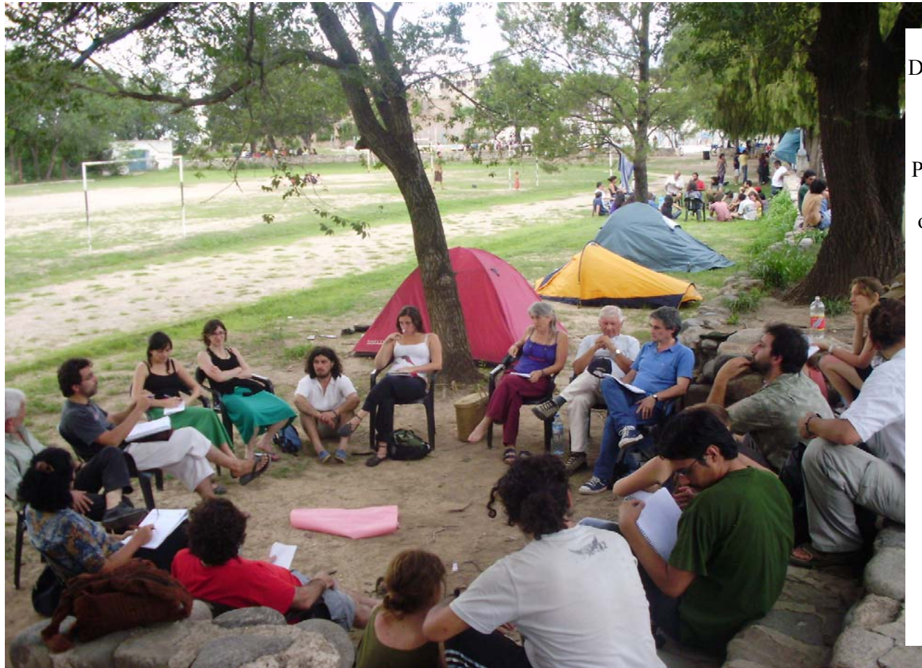
IMAGEN 2: Durante la tarde, alrededor de treinta hombres y mujeres fueron conformando cada una de las ocho comisiones en el predio del Club Pucará. Acciones directas, planes de lucha, pronunciamientos y organización interna fueron los ejes a discutir durante la segunda jornada.